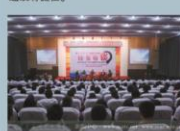
校友讲坛 传承·创新·发展——努力打造建院学子核心竞争力