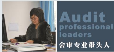
Audit professional leaders 会审专业带头人

大学生的核心竞争力是不易被对手模仿的，具有竞争优势的，独特的知识和技能，是我们综合素质的集中体现。踏实是支撑我们在激烈的社会竞争环境中积极把握的主动权，在竞争中取胜的唯一法宝。