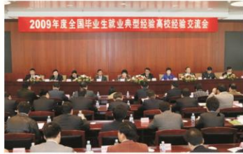
4月26日，教育部在北京召开2009年度全国毕业生就业典型经验高校经验交流会。