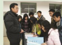
教授参加本科建设（毕业论文写作）课

问：像我们四川建院，在“后示范”建设中，从战略高度说，您觉得还需要从哪些方面去努力？