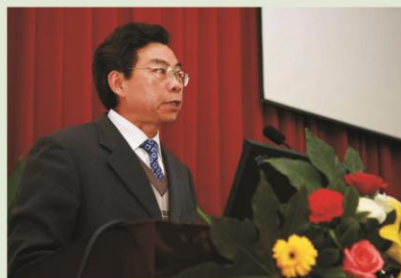
林教授主持多所高校参与“教改论坛”大会